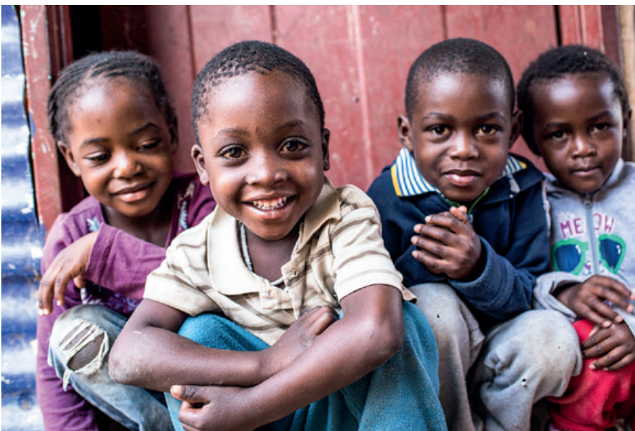
Kinder in der Suppenküche in Havana, dem Wellblechhüttenstadtteil von Katutura. Das Projekt wird seit dem Beginn in 2010 von Pallium finanziert.

Die graue Kulisse dabei: Die Lebensverhältnisse für die Marginalisierten im Land, vor allem für die Kinder, scheinen sich eher zu verschlechtern. Das beliebte Reiseland Namibia steht (mit Zambia und Malawi) weltweit an der Spitze der Länder, die am stärksten von Unternahrung betroffen sind (WFP Hunger Map 2015).