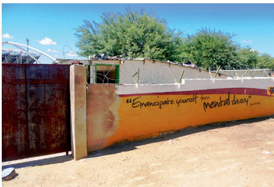
Das gegenwärtige Dolam Kinderheim in der Ewa Schuhmacher Street in Katutura.