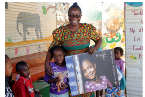
Strahlende Gesichter auf und neben dem Strahlemann-Kalender, den wir im Oktober 2016 in der Suppenküche überreicht haben.