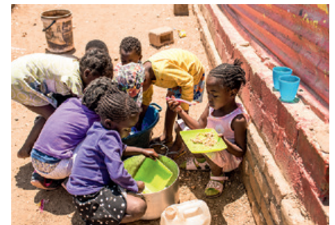
Die Kinder beim Abwasch. Anschließend gehen sie nach Hause.