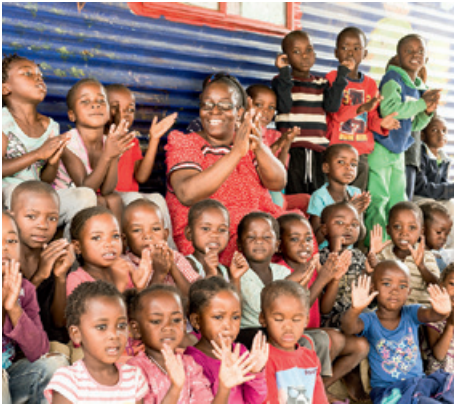
Jeder Tag beginnt mit Singen. Die Nachbarn erfreuen sich daran.