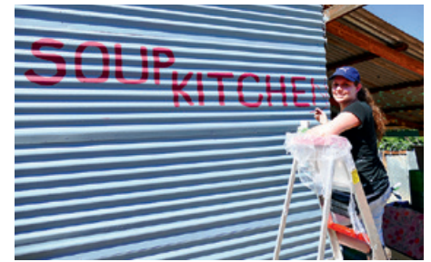
Sinnvoll Unterwegs e. V. beim Arbeitseinsatz in der Suppenküche.