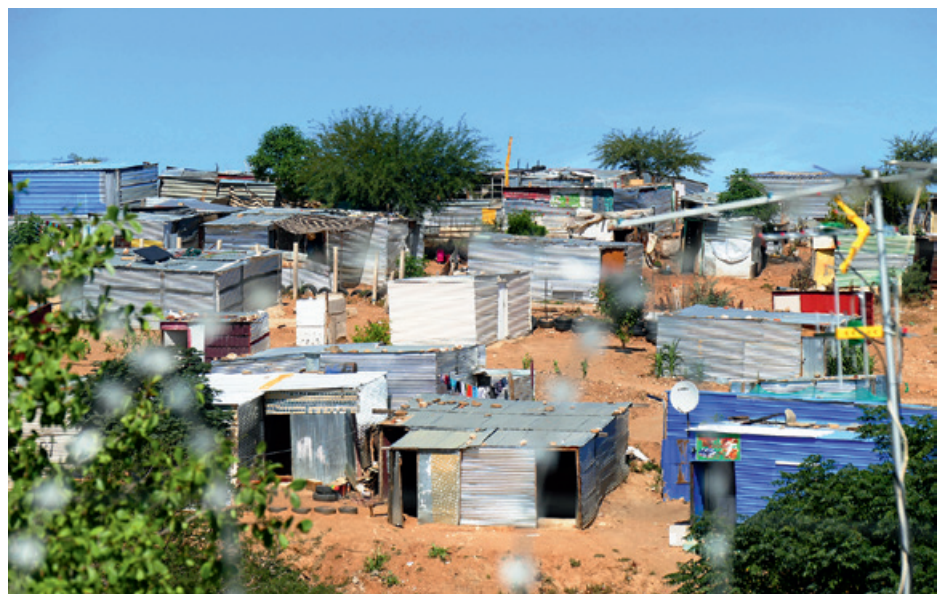
Havana. Hier befindet sich die Suppenküche und hier lebt auch Theresia mit ihren Kindern.